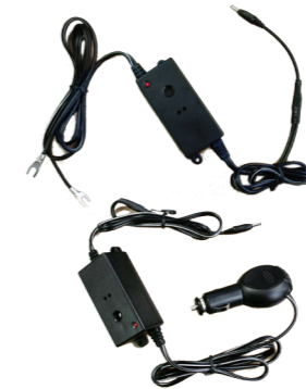
KIT REMOLQUE (12V 24V) PARA TRANSPORTE