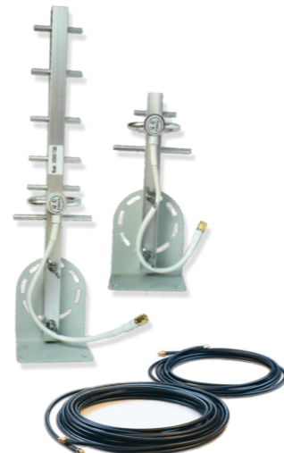
ANTENAS-A300 EXTENSORA DE ALCANCE