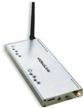
VIDEOLINK PARA EXTRA ALCANCE