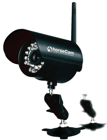
CÁMARA VISIÓN NOCTURNA INALÁMBRICA