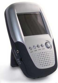
2,5" LCD MÓVIL CON COLOR Y SONIDO