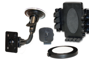
SOPORTE PARA MONITOR LCD